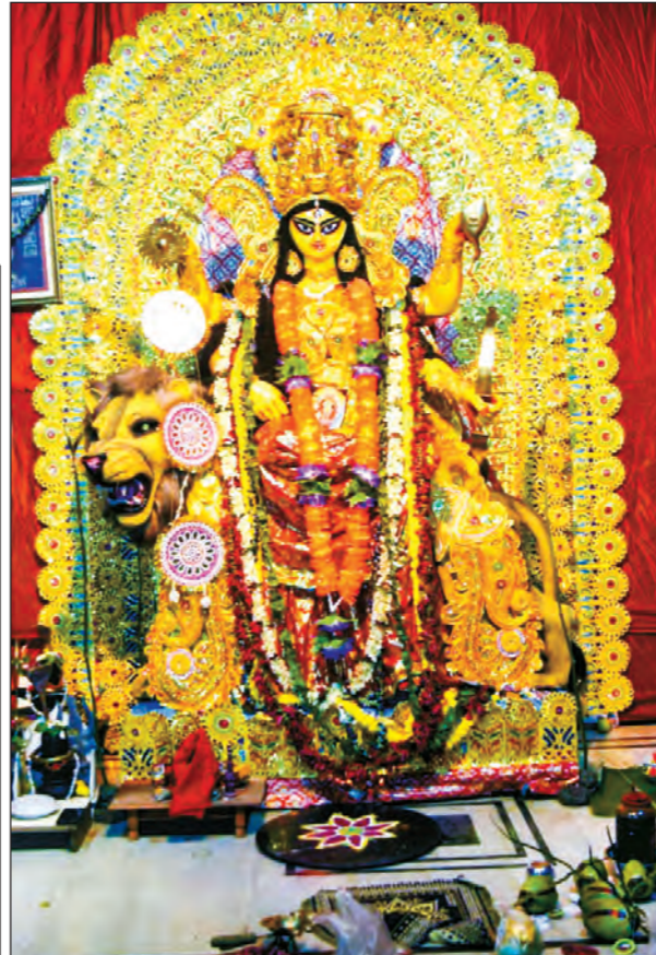
দক্ষিণ ২৪ পরগনার সোনারপুরের গোঁর্খা আদিবাসীবৃন্দের জগদ্ধাত্রী প্রতিমা।

প্রসঙ্গত, সাংসদের এই উদ্যোগে অত্যন্ত খুশি বারাসতবাসী। তাদের বক্তব্য, সামনেই শীতকাল। এমনিতেই সাজের পর রাস্তা ফাঁকা হয়ে যায়। ফলে সেইসময় চুরি হিনতাইয়ের ঘটনা বেড়ে যায়। সাথে সামাজিক অপরাধও। ঠিক তার আগেই সাংসদের এই উদ্যোগ অত্যন্ত প্রশংসনীয় বলেই মনে করেন তারা।